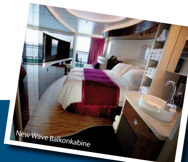
New Wave Balkonkabine