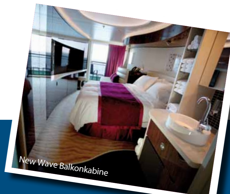
New Wave Balkonkabine