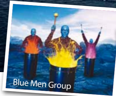
Blue Men Group