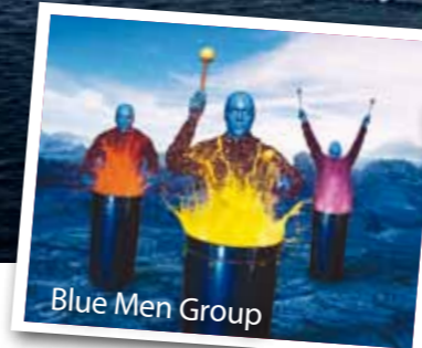
Blue Men Group